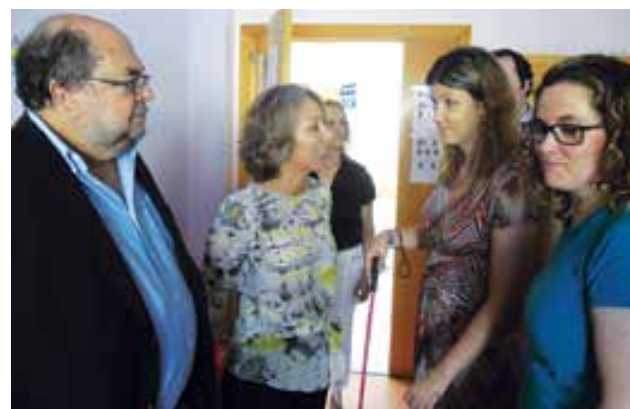
CERCIOEIRAS já recebeu a visita da secretária de Estado do sector