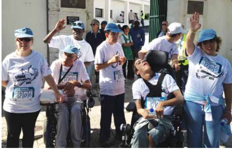
MARCA DOS COMBATENTES PELA PAZ