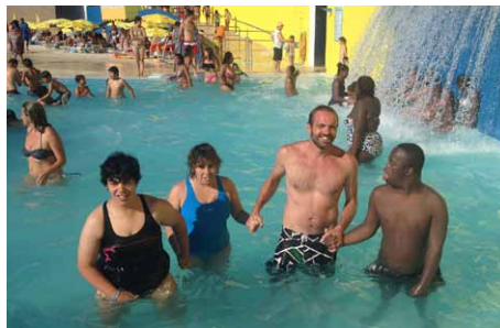
IDA À PISCINA