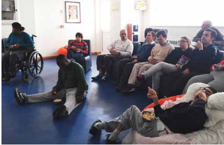
SESSÃO DE CINEMA